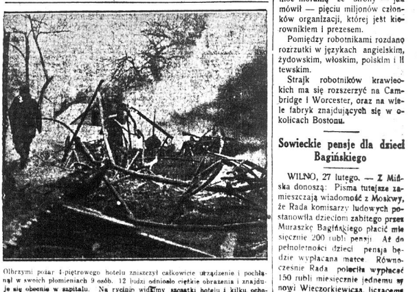
Obliwający pozar 4-piętrowego hotelu zniszczył całkowicie urządzenia i pochłaniał w swoich płomieniach 9 osób. 12 ludzi odniosło ciężkie obrażenia i znajdują się obecnie w szpitalu. Na rybnym wędlinym szczątku hotelu i kilku osobników zamieszkałych ciał obcych zabito