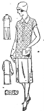
Najnowszy model wiosenny, miary na 16 lat, 36, 38, 40 i 42 cale bluzki.