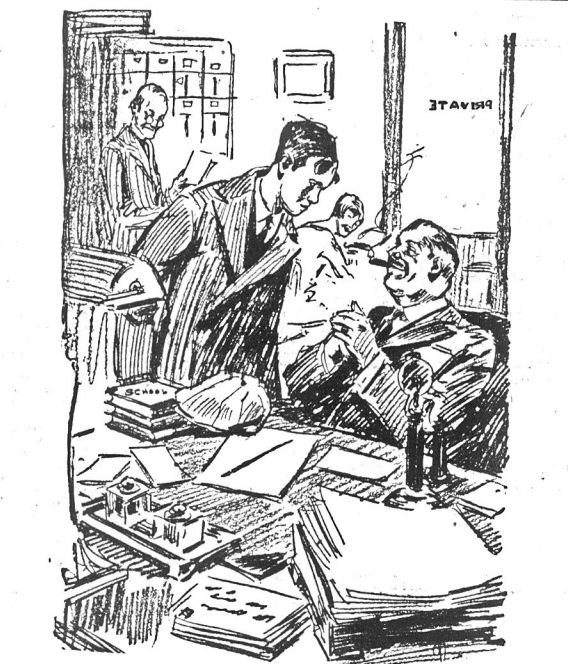
Synek chce dostać od tatusia trochę gotówki na — potrzeby naukowe. — Hm — powiada tatus — nie wypuszczaj z ust cygara — na potrzeby naukowe? Dobrze! Dziesięć dolarów? Też dobrze! Ale niech wem przynajmniej, jak jej na Imię i gdzie ona mieszka.