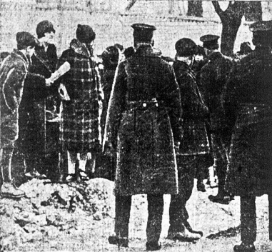
Przy tłumieniu rozruchów w Passaic, N. J. policja użyła koni, motocykli i bomb wywołujących łzy. Wśród tłumy, który wzięli udział w demonstracji znajdowało się dzieci i kobiety. Policjanci w brutalny sposób rozposiadli demonstrujących, nie biorąc pod uwagę ani wieku ani płci demonstrantów.

PARYŻ, 3 marca. — Parlament francuski zatwierdził pakt gwarancyjny w Locarno 413 głosami przeciw 71, po trzech dniach przebiegających w wieloletnich debatach. Za zatwierdzeniem głosowały prawie wszystkie stronnictwa rządowe i konserwatyści, którzy głosowali za zatwierdzeniem, by nie powściągnąć opozycji, w której wzięli udział prawie sami komuniści. Od głosowania wstrzymało się 100 posłów w przekonaniu, że dawny system przymierzy i równowagi politycznej jest lepszym od lokarnskiego paktu gwarancyjnego mającego rzekomo zapewnić pokój Europie. Premier Briand odpowiadając przeciwnikom paktu gwarancyjnego w związku z gorącą polemiką toczącą się w prasie wszystkich państw europejskich oświadczył, że sprawa powiększenia stałych członków w Radzie Ligi Narodów nie przedstawia żadnego niebezpieczeństwa i Niemcy nie otrzymały żadnych zapewnień, że tylko im samym zostanie przyznane stałe przedstawicielstwo w Radzie Ligi z wyłączeniem innych państw.