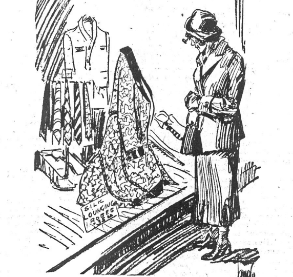
Jedwabny szlafrok, a do tego pantofle. Czyż można wyobrazić sobie piękniejszą prezent świąteczny dla małżonki, urodzonego z natury rzeczy pantoflarza.