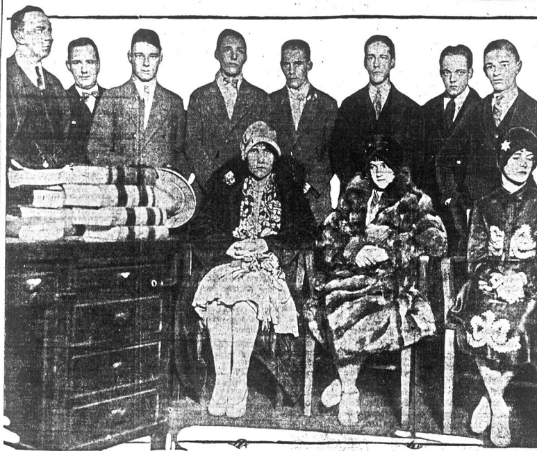
Just to banda młodziących bandytów, którzy popełnił dwuletni zabójstwo i zamordował jedną ofiarę zbrojnego napadu...