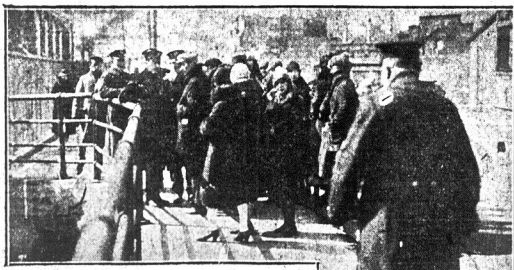
Razem strajkujących robotników przedsiadających domagali się aresztowania komunistów policy w Pasenskiej, gdyż używa on konających taktyk przy rozpędzaniu tłumów demonstrantów. Na rycinie widzimy strajkujących robotników, zatrzymanych przez policy na Ackerman Bridge.