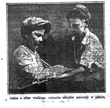
Jedna z ofiar wielkiego wybuchu składów amunicji w pobliżu...