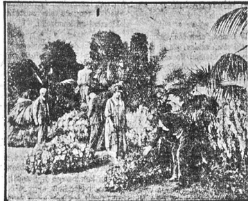
Morze barw, kształtów i woni

nie napawać wzrok i powonienie piękniemi kształtami, barwami i zapachem kwiatów łazienkowskich.