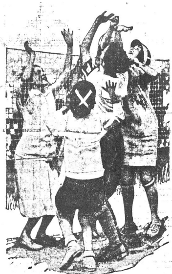
Dziesięć strajkujących robotników w Passaic, nie przejmając się przeciągającym się strajkiem i uromacniają sobie czas grą w piłkę