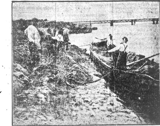
Piaskarze przy pracy

Bilety do nabórka w Consolidated Ticket Office lub Hudson Terminal. Po Informacje telefonujecie Wisconsin 420 lub Connecticut 228.