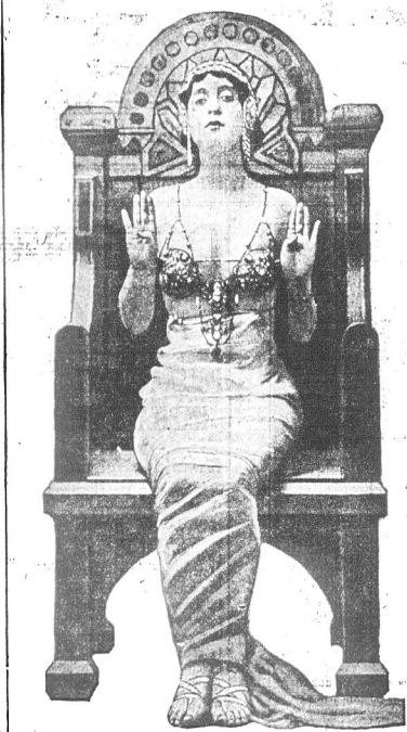
Lina Cavalieri, włoska gwiazda operowa, jest zwolenniczką dyktando. Proponuje ono również, ażeby Mussolini wypowiedział swoje zdanie w tej materji. Jak gdyby on nie miał innych kłopotów niż głowie.