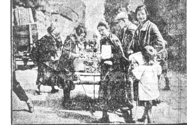
„Goście wiejszy z sadów” — jabłka na wiziecie u mieszczuchów

nych powolnem zamieraniem latu. Gdy w lecie my wyjeżdżaliśmy do „przrody”, aby czas wakacyjny wypoczynku poświęcić choćby krótkim z nią stopni-kom, w jesieni ona jakby nam czes odzwajmniajaco, rewizyjnie