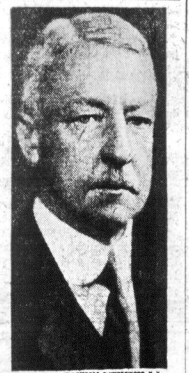
James R. Sheffold, ambasador Stanów Zjednoczonych w Meksyku

WARSAWA, 25 września. — W Marcinkowicach pod Nowym Szacem nastąpiło niezwykle oberwanie się chmury. Rzeka Smolnik oraz małe potoki górskie wzebrały w niebывалych rozmiarach i zniżyły z górkami, zaważając pola i zamulając pozostałe rzeki. Między innymi: rzekami Męcina i Marcinkowice tor-kolejowy został zaspany kamieniami do wysokości i metra. Kasta-strofy takiej w tych stronach jeszcze nie pamiętano. Bezwy-czna pomoc zarządu dla ludności jest konieczna.