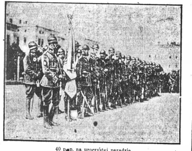
40 pp. na uroczystej paradzie

święto pułkowe „Strzelców Lwowskich” Czterdziesty pułk strzelców lwowskich, znany pod nazwą „Czterdziestki” obchodził święto pułkowe, które znalazło serdeczną się do Lwowa, tworząc pierwszą kompanię 3 p. strzelców lwowskich pod komendą kap. Weissa.