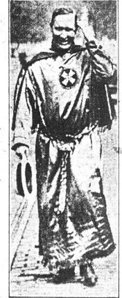
Dr. Hiram W. Evans, objął ponownie urząd lidera organizacji Ku Klux Klanu.