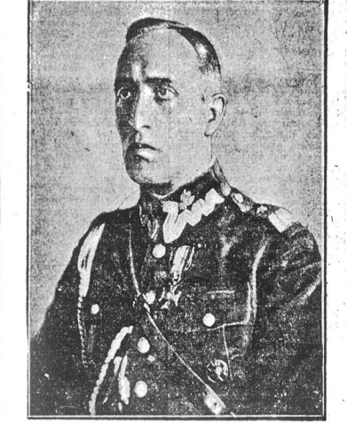
Gen. brg. Gustaw Dreszer

Do stworzonego obecnie Generalnego inspektoratu armji, w nowym został m. in. gen. brg. Gustaw Dreszer, poprzednio dowódca 11-iej warszawskiej dywizji kawalerji.