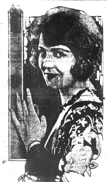
Doris Kenyon musiała odczytać goły weselną z powodu lekkiej infuzji na którą zapadła ostatnio. Piękna Doris ma zostać wkrótce żoną Milтона Silasa, odgrzyającego zwykłe rolę 100 procentowych męzcyzn na srebrnym ekranie