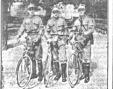
Przed wyjazdem w świat