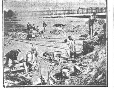
Na Placu Broni praca widać w całej pełni