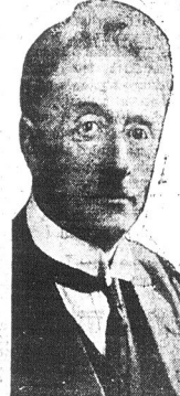
Prezydent Woinego Państwa Irlandzkiego, Cosgrave, który zażądał uchwalenia od parlamentu surowych praw dla uchronienia niepodległościowej działalności Sin-Pinistów.

stwie detektywa odesłano je na koszt miasta do Manhattan, gdzie na stacji policyjnej w Bronx spoki obie dziewczyny rozprzeżni rodziców. Tak jedna jak i druga obcały poprawę, to jest wytknę sobie raz na zawsze z głowy podróżywania piechotą i bez wiedzy wycieczki po Stanach Zjednoczonych.