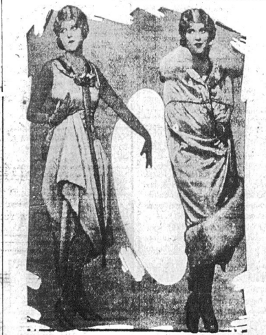
Artystka Helen Menken może dać grę główną rolę w sztuce „The Captive”...