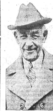
Edward W. Bok, apostoł idei pokojowej i inicjator nagrody pokojowej, odwiedził w tej sprawie prez. Coolidge'a.