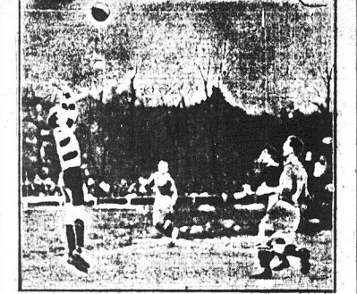
Gross odbija wysoko piłkę

Do finału w bieżącym mistrzostwie Polski dotarł 3 drużyny: Polonia, Pogon i Warta. Mistrz stolicy rozegrał z Wartą pierwszy mecz w Poznaniu, gdzie ponosił porażkę. Rewanżowe spotkanie odbyło się w Warszawie i przyniosło pełny sukces Polonii, która pokonała rywala w stosunku 5:1.