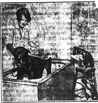
Przedwzięta kapłan nie przypada do gustu dwóm młodym piosenkom, które, patrząc na swego towarzysza Rummy, oczekują z niepokojem swojej kolejki.

Wspierajcie do Komitetów im. Piłsudskiego!