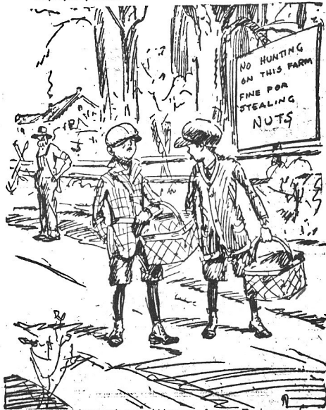
Nieudały zamach na ogród baczego farmera. Trzeba wrócić do domu z pustymi koszami.