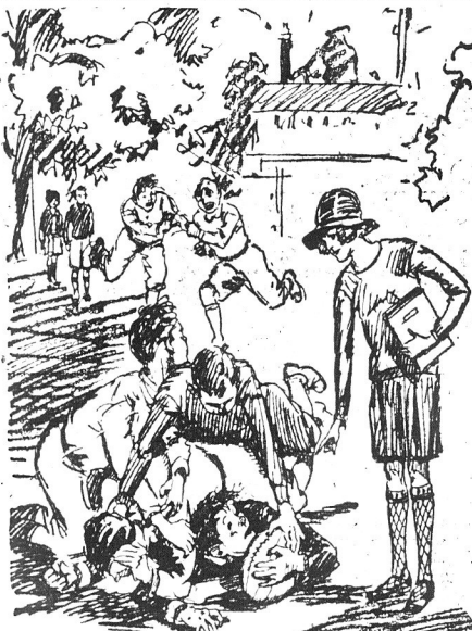
Młody „mistrz” futbolu spotyka swoją przyjaciółkę... w tak niepożądaną chwilę.