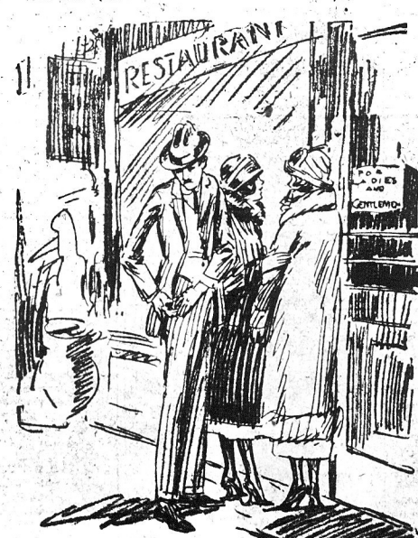
Będą przewidującym. A nuż się trafi nieprzewidziany wydatek. Wszak mężczyzna zawsze płaci.