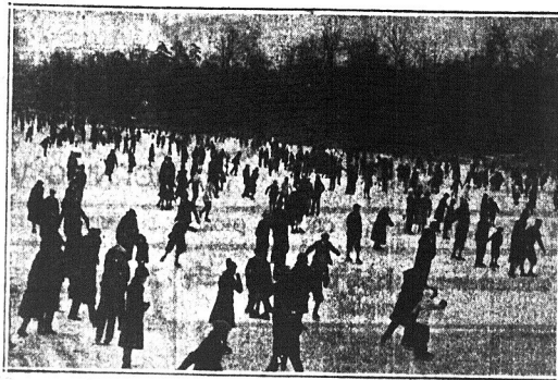
Staw w Central Parku jest obecnie Mekką tysięcy dzieciaków, które pragną skorzystać z okazji użycia przejazdki na łyżwach.

Ważne sprawy do omówienia. Bezwarunkowo wszyscy człon- kowie powinni i są proszeni sta- wić się w lokalu klubu, pn. 105 St. Mark's Place, N. Y., o godzi- nie ósmej punktualnie. I. KOZYRA, Sekr.