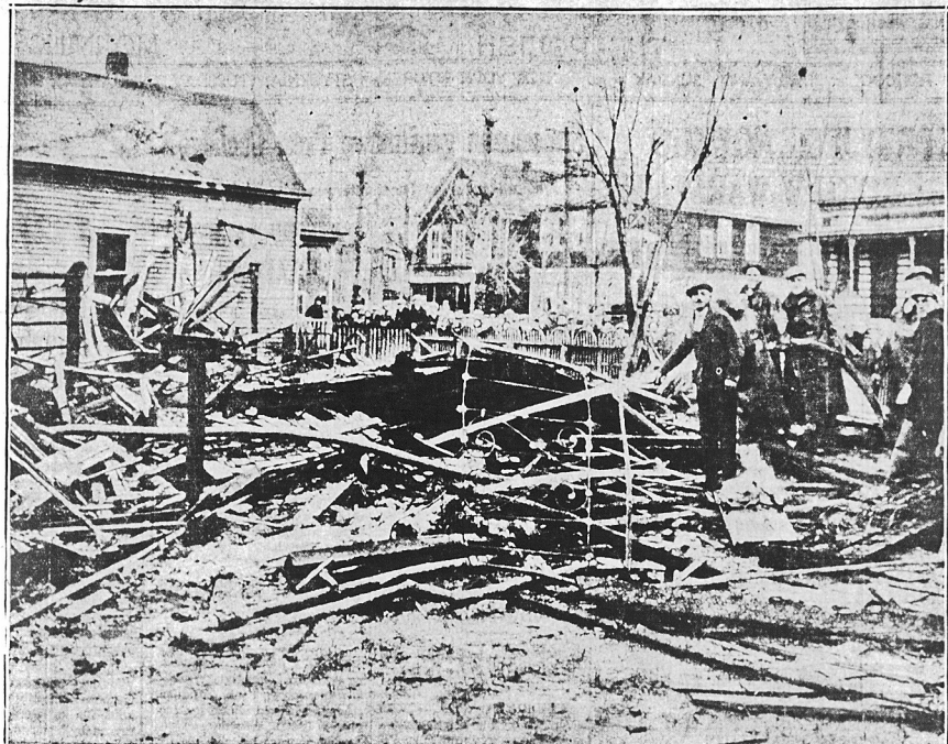
W straszliwej eksplozji która zrównała z ziemią dom pod nr. 49 De Witt ulica w Garfield, N. J. odniosło obrażenia 12 osób, które znajdują się obecnie w szpitalu. Eksplozja została wywołana wybuchem gazu w piwnicy budynku. Policjant, który zapalił zapalnik w wypełnionej gazem piwnicy został odrzucony na odległość 50 stóp. Siła wybuchu była tak znaczna, że szyby powylały z okien w wyplnionej gazem piwnicy.