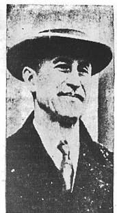
Ostatnia fotografia Orville'a Wrighta, jednego z pierwszych lotników, który zdołał dokonać skutecznego lotu na aparatach cięższych od powietrza.

Dlaczego Wasz sąsiad nie czyta Nowego Świata? Zapytajcie go i wytłumaczcie mu czym to pismo jest dla Czytelników.