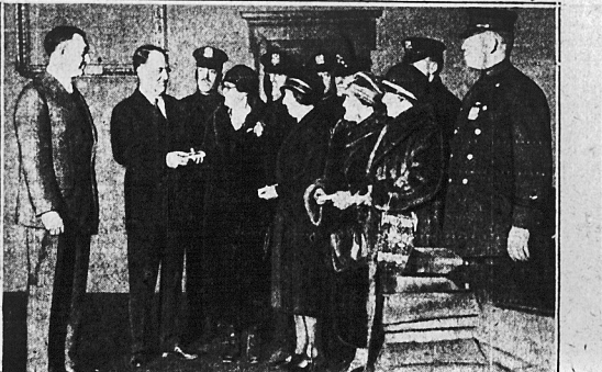
Hada niasta New Yorku złożyła wczoraj hołd p. radka. Na rycynie widzimy zastępę mayora K. zabitych polejantów. Komisarz policji (po lewej) policjanci, uwidocznieni na drugim planie, wzięli przynajmniej jedno z nich.

OWA i trzy pokoje do wynajęcia. Liczba 171 Grand Street, Jersey City, N. J. (42)