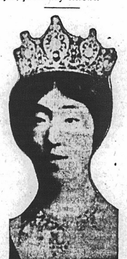
Ze śmiertelą mikadą na tronie japońskim zasady znaczenie zmiany. Mikadę Hirohito jest obecnie cesarzem Japonii, a jego małżonką księżną Hirohito cesarzową.

Zagadnienie żeglugi powietrznej rozwiązał, jak wiadomo, silny i lekki motor spalinyowy. Od chwili zastosowania przez braci Wrightów silnika samochodowego Leveassura do wynalezienia przez nich samolotu, silniki lotnicze uległy olbrzymiej ewolucji, wytworząc się wprost zawiązującą w stosunku do swej objętości i wagi. W miarę jednak zwiększenia wysokości lotu okazało się, że na znacznych wysokościach, przy rozróżnieniu tam powietrza, silniki spalinyowe pracują gorzej i nie tak równomiernie, jak niedaleko powierzchni ziemi, to też zysk z przyspieszenia lotu na znacznych wysokościach, wskutek mniejszego oporu powietrza rozróżnionego, okazał się iluzorycznym. Jednocześnie wiązało z rozwojem silników spalinyowych postępowała też praca nad ulepszeniem maszyn parowych. Wynaleziono turbiny parowe, zmniejszające znacznie wagę i objętość maszyn takich. Obecnie inżynierowie Niemiec zbudowali turbinę parową nie zwykłą lekką, pracującą pod nadzwyczaj wysokim ciśnieniem (50 atmosfer i opalającą olejami ciężkimi dla wytwarzania pary. Turbina taka jest tania i pewna, a prztem pracuje jednakowo tak na znacznych wysokościach, jak i na powierzchni ziemi. W ten sposób powstało nowe cudo techniki: latająca maszyna parowa, która znajduje niebawem zastosowanie szerokie w że