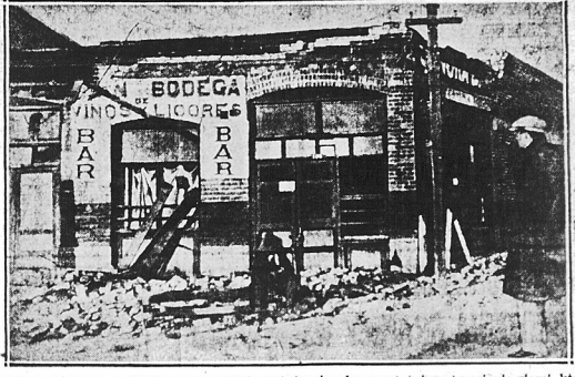
Miasto Calexico w Kaliforniji uderpiału najwięcej podczas ostatniego trzęsienia ziemi, któ- re dało się odczuć dotkliwie w Imperial Valley. Na rytnie widzimy budynek zniszczo- ny gwałtownym wstrząsem podziemnym. Ogólne szkody przewyższają sumę 21 pół mil. dol.

WASHINGTON, 5 stycznia. — Sen. Wheeler, demokratę ze stanu Montana, złożył w senacie wniosek w sprawie niezwłocznego wywołania amerykańskich sił mor- skich z wód Nicaraguy. Senator Wheeler w motywach do wnios- ku wychodzi z założenia, że li- beralny rząd Sacasa jest rzdem kon- stytucyjnym i awansowanie tego rządu przez Stany Zjed. nie może być usprawiedliwione żadnymi moralnymi względami. Jednocze- śnie senator Shipstead zaprote- stował przeciwko „tworzeniu sy- tuacji bałkańskiej” w łacińskich republikach Ameryki Środkowej.