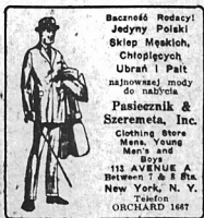
Baczność Redaktor! Jedyny Polaki Ciepłochy, Ubrań i Pałt nabywajcie do nabicia. Pasiecznik & Szeremeta, Inc. 113 AVENUE A, New York, N.Y. Orchard 1647

Nowo wynalazona w Anglii szymba samochodowa umieszco- na w tylnej części samochodu, waży zaledwie kilka uncij i jest na tyle elastyczna, że podczas nieużywania można ją złożyć.