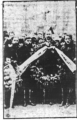
Delegacja włościanka z wieńcem nad grobem autora „Chłopotu”.