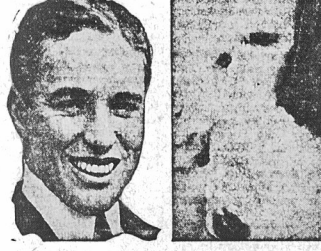
Proces rozwodowy, wytoczony Chaplinowi przez jego małżonkę Litę Grey Chaplin, opiera się na sensacyjnych oskarżeniach. Zona zarzuca artyście, iż uwiódł ją jeszcze przed ślubem i skarży go o niewierność i liczne miłości z innymi artystkami.

Czego nie robi się dla filmu? Uroczą artystką niemiecką, Lia Eibenschutz posiada, jak wiadomo, cudowny spłot kędzierzawy, czarnych włosów.