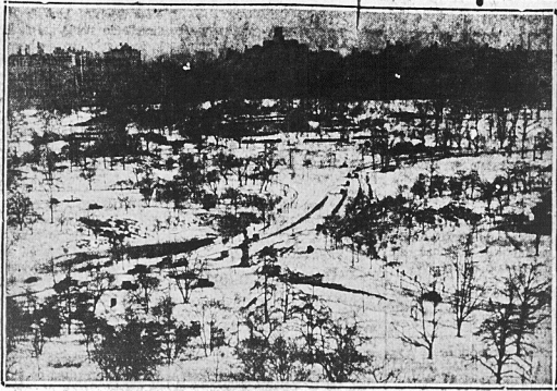
Po śnieżnej burzy, która nawiedziła ostatnio New York z okolicami, Central Park wygląda bardzo 'arktycznie'...