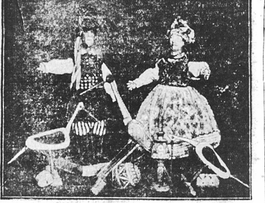
Lalki etnograficzne Polskiego Towarzystwa Przemysłu Ludowego oraz bociany pięknie wyciętane i malowane po wsiach polskich.