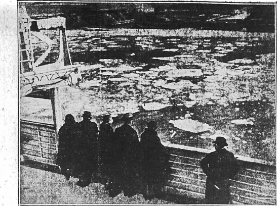
Pasażerowie, którzy przybyli na okręcie z Bermud, wyrzucili całą natchyniastowego portow, widząc, że Hudson jest jeszcze pokryty grubą lodową. Fort Victoria, statek, na którym przyjechali, dobił do przystani z trzygodzinnym opóźnieniem wskutek burzy.

osobisty, i w tym wypadku, gdy placący podatek jest samotny i nie posiada członków rodziny, którym udzielałby pomocy, wówczas postępuje, jak wskazuje poniższy przykład: