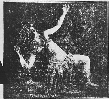
mistrzynie tańców plastycznych.