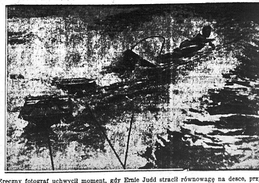
Zrezygnował fotograf uchwycił moment, gdy Emle Judd stracił równowagę na desce, przy- mocowanej do łuski, z szybkością strzały motorówki i wpadł do wody. Ernle powiada, że ten sport jest najodpowiedniejszym dla ludzi, szukających silnych wrażeń.