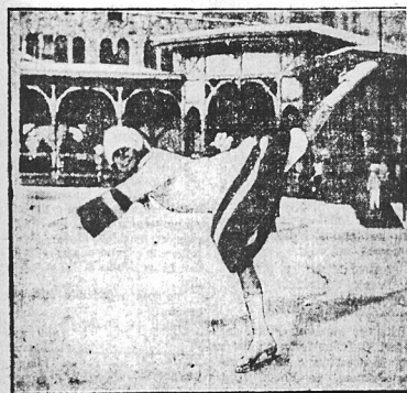
królowa sezonu lyżwiarzkiego w St. Moritz.