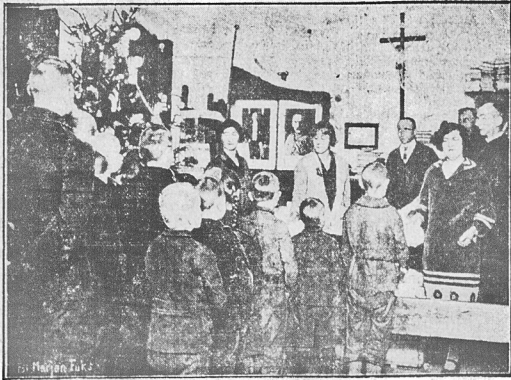
Rozdawanie darów gwiazdkowych w Jastarni, przywiezionych przez delegację z Warszawy.