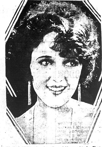
Przyjmującej na dwa lata Carmel Myers, aktorka filmowa, musi wrzesc się ewentualnych przyjemności matematy, w przeciwnym bowiem razie stracił popłatny „Job” u Rudolfa Frimla, dla którego ma komponować rzewne piosenki. Carmel jest jednocześnie śpiewaczką i twórczynią modnych melodii.