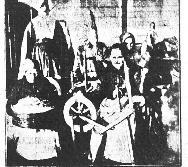
— Kręć się, kręć, wrzeczono — wód się, nitko, wód! — poświęnij sobie w ciepłym żakietu przy kolowrotkach pensjonariuski Warszawskiego Towarzystwa Dobroczynności.

Jeś na Krak. Przedmieściu na miejscu części slynego ongi na haju Kananowskich, czekał zaś główny klasztor Karmelitanek-Bosackich, — przebudowany przed stu laty przez Coraziego, gmach z napisem „Res sacra miser”.