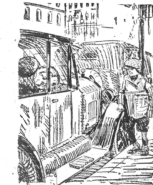
Gazeciarz i jedynaczka króla smalcu — czyli pierwsze strzały amora.

Prawdopodobnie jest to nerwica sercowa. Musi Pani być pod opieką lekarską. Nie pracować ciężko, regularnie łąć spać, codziennie spacerować przez pół godziny. Dbać o regularne stołce. W razie ataku połogię się na godzinę i przyłożo na okolicę serca zimny okład. Na bezsenność pół grama bromu na pewno pomoże. Musi Pani dać zbadać moze, czy nie zawiera jakichś abnormalnych części, np. białka. Nie nanielbywać się, nie bezwzględnie dać się zbadać.