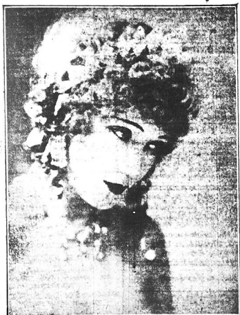
Dzisiaj premiera filmu „Kabaret” Gilly Gray na Fundusz Kościuszkowski.