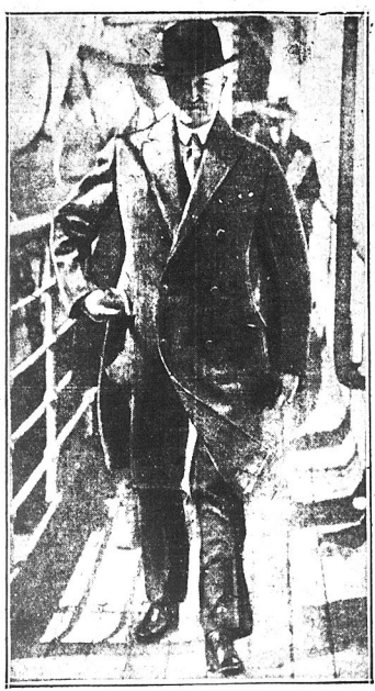
General Pershing udał się do Francji na pokładzie okrętu George Washington w celu omówienia kwestji zamiany drewnianych krzyżów na kamienne pomniki na mogiłach poległych żołnierzy amerykańskich.

Na rasowe konie dla polskich kawalerzystów... Ja niżej podpisany złączam... dolarów na kupno rasowych koni dla polskich jeźdźców... Imię i nazwisko... Adres... Miasto... Stan... Wynajm wypelnij — i wyśl do Nowego Świata — 24 Union Square, New York City