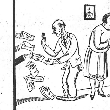
Tatusz w długach, mama w strachu, a córeczka, jak była, tak i jest panną...