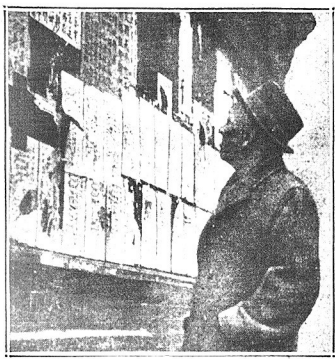
Chłirczyk z nowożytnego Chinatawa odczuwał wiadomości z walk w swojej ojczyźnie oraz zmiłniami o wojnie „longów”, która rozpoczęła się na nowo w miastach amerykańskich, zamieszkałych przez żytych obywateli.

BERLIN, 28 marca. — Pisma berlińskie donoszą z Moskwy, że