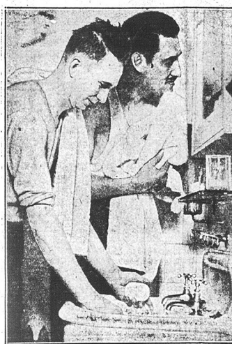
Zdobycy rekordu powietrznego przyprowadzą do normalnego stanu swój wygląd po 51 godzinach locia nad Long Island.

CZYTELNIK W STANIE New Jersey znajdą bardzo ważne ZAWIADOMIENIE dotyczące się ich własnych interesów, w następnym numerze niedzielnym NOWEGO ŚWIATA