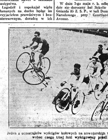
Jeden z uczestników wyścigów kółowych na nowojorskim wiecuromie wyinał kółkoma, wobec czego trzej tlni wyścigowcy posali w jego ślady.

(B-73) W sobotę 30-go kwietnia, o godz. 8-jej wiecz., odbędzie się bal Polsko-Amerykańskiego Klubu Republikkańskiego na Williamsburgu, w sali ob. Lachary, pn. 76 North 6th St. Komitet obcuje mnóstwo nie spodzianek i zaprasza sympatycznych Klubu na ten bal.