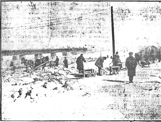
Roboty ziemne przygotowawcze do nowego parku nad Wisłą

Pomimo posiadania ogrodu Saskiego i ogrodu Kasimierskich w śródmieściu, a parku Łazienkowski i Łazienek nieco dalej - Warszawa nie należy do miast posiadających dużo zieleni. Karłowate drzewka ulicy Marszałkowskiej lub wyciemniane starych