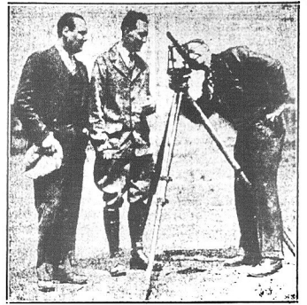
Lotnik Byrd, jego mechanik i pilot poddają próbie kompasu słonecznego, jaki im będzie służył podczas podróży ponad oceanem.

Prosimy usilnie Szan. Polonoje o wcześnie przybycie na popis działy, ponieważ program zaczyna się punktualnie o godzinie 8:00 wieczór.