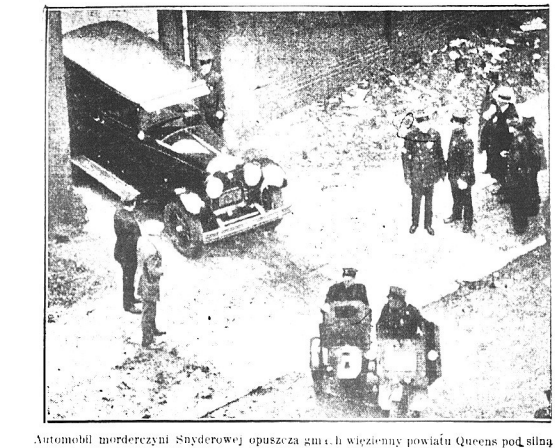
Automobil mordercy i Snyderowej opuszcza zmił i w nieznanym powiatu Queens pod silną eskortą policji uzbudzonej od stop do głow