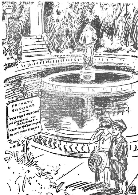
Nie lubię palców, wolę domek na dwoje.