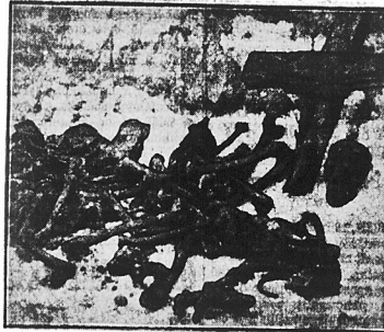
W Skierniewicach odkryto cmentarz rozstrzelanych bez sądu i wyroku obywateli polskich.

Następnego dnia wszystkich dwunastu rozstrzelano. Obecnie Karwat poznaje wśród wykopanych szkieletów buty nieszczęśliwych chłopów. Pozna je po charakterystycznym szczególe —