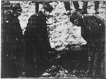
Rozkopywanie cmentarza pod Skierniewicami.

O rozstrzelaniach ludność miała zawiadomienia hurtem w formie mniej więcej następującej: „Na walcach koszarowych, rozstrzelano X szpiegów, schwytanych na szpiegostwie”.